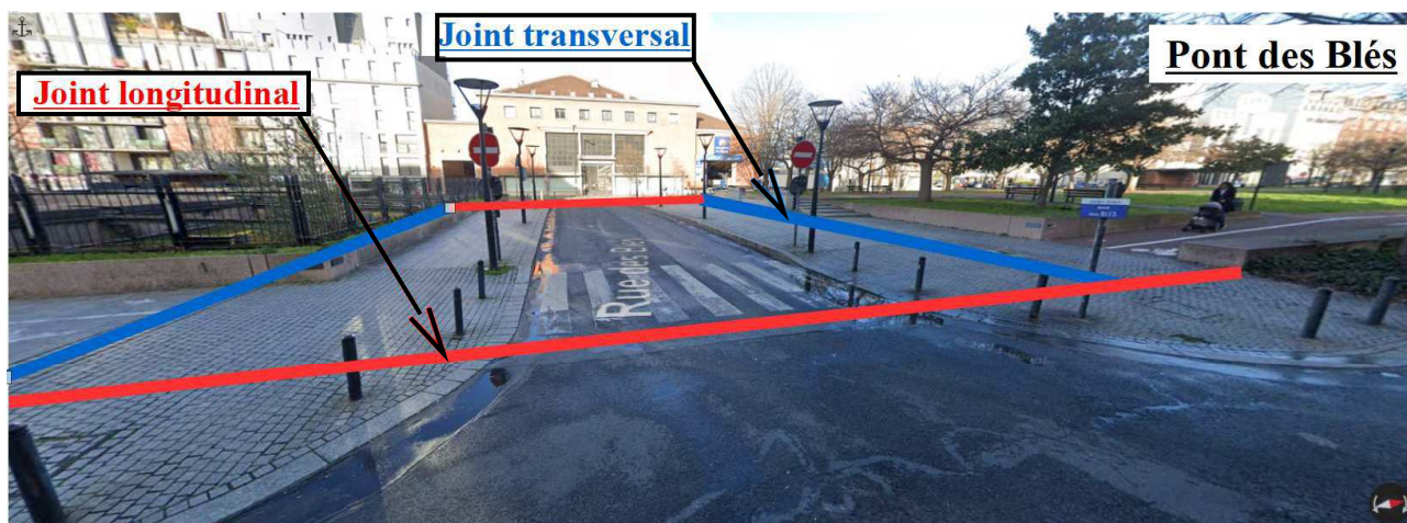
Localisation schématique des différents joints de chaussée du Pont des Blés

État actuel du franchissement et de ses abords avec une matérialisation schématique des joints.